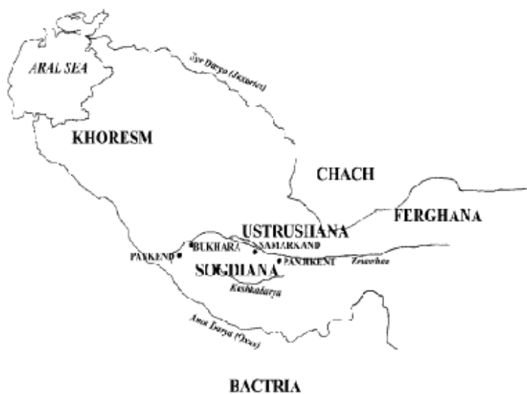
Fig. 1. - Harta statului Ustrushana; http://silkrroadfoundation.org/newsletter/december/archaeology.htm