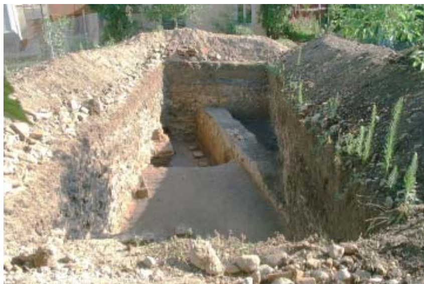
Fig. 4. - Alba Iulia, Sala cu picturi și hypocaust – vedere de ansamblu, de la sud spre nord, a suprafeței S I.