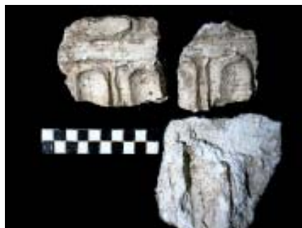
Fig. 10. - Alba Iulia, Sala cu picturi ȳ hypocaust, fragmente de decor parietal, etapa III, corniȳ din stuc cu ove.