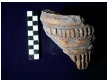
Fig. 8. - Alba Iulia, Sala cu picturi și hypocaust – fragment de decor parietal, etapa III, baza de pilastru din ceramică.