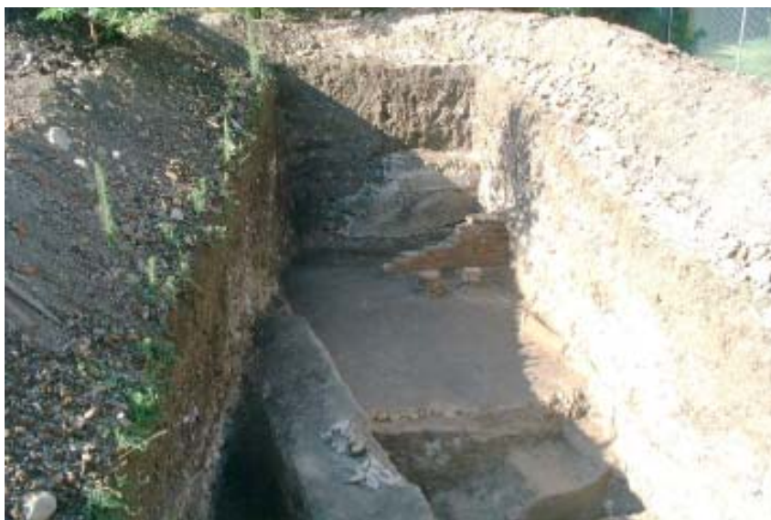
Fig. 7. - Alba Iulia, Sala cu picturi și hypocaust – etapa III, hypocaust 2, perete de refacere la hypocaust 2, zidul B cu urmele de jonchiune ale pardoselilor opus signinum 2 și 3.