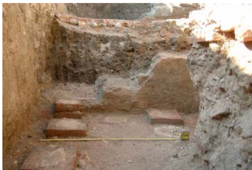
Fig. 6. - Alba Iulia, Sala cu picturi și hypocaust – etapele II și III, zidul C, opus signinum 1, hypocaust 1, opus signinum 2.