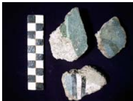
Fig. 9. - Alba Iulia, Sala cu picturi și hypocaust – fragment de decor pictat cu elemente vegetale din zona plintei, etapa III.