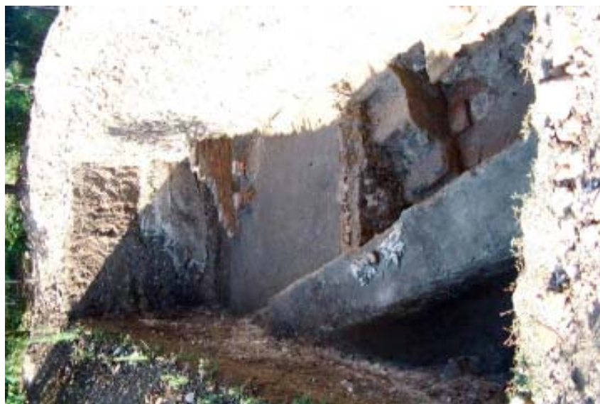
Fig. 3. - Alba Iulia, Sala cu picturi și hypocaust – vedere de ansamblu, de la nord spre sud, a suprafeței S I.