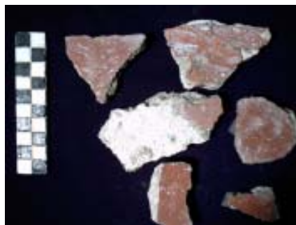
Fig. 11. - Alba Iulia, sala cu picturi ȳ hypocaust – fragmente de decor pictat din zona plintei, etapa IV.