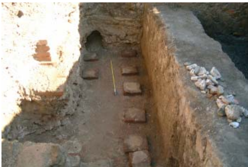
Fig. 5. - Alba Iulia, Sala cu picturi și hypocaust – etapa a II-a, opus signinum 1, hypocaust 1, zidul A cu paramentul interior tencuit.