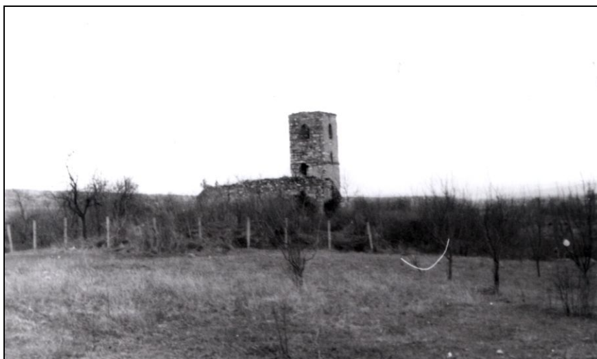
Fig. 1 – Benic. Biserica reformată. Vedere generală dinspre nord-vest