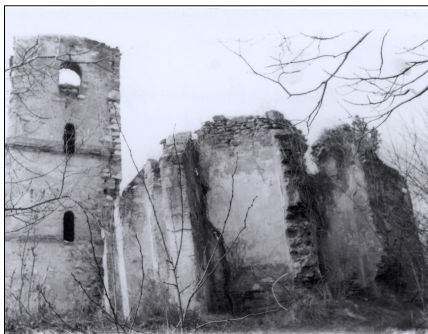
Fig. 2 – Benic. Biserica reformată. Vedere dinspre est