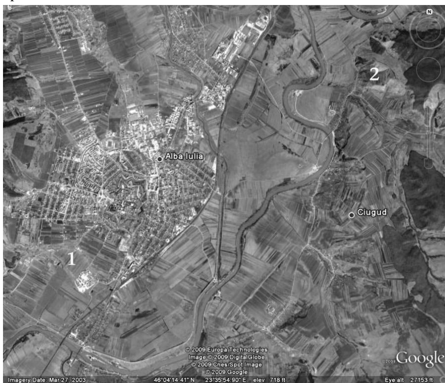
Fig. 1. - Amplasarea așezărilor de la Alba Iulia „Dealul Furcilor- Monolit” (1) și Teleac (2).

În urma cercetărilor arheologice preventive întreprinse la Alba Iulia, „Dealul Furcilor-Monolit”, zonă plasată pe partea stângă a drumului județean Alba Iulia – Pâclișa, pe prima terasă a râului Mureș, a fost descoperită o așezare din prima vârstă a fierului.