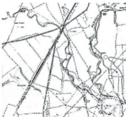
Fig. 1. - Amplasarea punctelor: “Bulza”, descoperiri G. T. Rustoiu; □ - “Bulza” II, descoperiri R. Gheorghiu, I. Lascu.

Piesa în discuție a fost descoperită în urma unor cercetări de suprafață, întreprinse în toamna anului 2000, pe raza municipiului Alba Iulia, în localitatea Oarda, pe terasa denumită “Bulza” 2 ( fig. 1 ); aici au fost descoperite materiale ceramice care aparțin mai multor epoci 3 . Din punct de vedere cultural, piesa în discuție aparține culturii Basarabi, fiind legată de materialul ceramic descoperit aici. Încadrarea cultural-cronologică s-a făcut după pasta din care este realizată, modul de ardere și decorul piesei, toate elementele fiind specifice acestei culturi 4 .