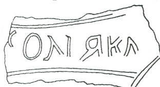
Fig. 3. - Desenul inscripției de pe mânerul de pateră de la Ocna Sibiului (după IDR, III/4).

O nouă încercare de descifrare a inscripției a fost făcută după câteva decenii, când este publicat și un nou desen ( fig. 3 ). Acum, inscripția incizată pe toartă a fost interpretată ca un antroponim 9 : SONOIK.