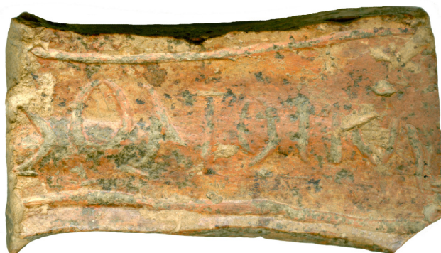
Fig. 5. - Fotografia mânerului de pateră cu inscripție descoperit la Ocna Sibiului.

dacice și, în general, în Imperiul roman. O primă dificultate reiese din faptul că divinitatea căreia îi fusese consacrată ofranda la care se referă inscripția (foarte probabil, chiar patera de la care provine toarta cu această inscripție, ca vasum sacrum ) nu are nici un epitet și că inscripția nu este însoțită de nici o reprezentare, încât este greu de precizat dacă este vorba de divinitatea romană Sol Indiges sau de Sol Invictus, o divinitate de origine orientală. Așa cum remarcase S. Sanie, deși Sol apare pe monedele romane încă din epoca Republicii, tipul iconografic cu Sol în cvadrigă, simbol al dominației sale asupra celor patru anotimpuri sau a celor patru elemente, este de origine grecească 11 ; cu toate acestea, deși există puține dovezi ale cultului lui Sol Indiges la Roma înaintea epocii imperiale, el pare o divinitate proprie veche, care nu este împrumutată de la greci, după cum nici edificiile consacrate lui Sol la Roma în timpul Republicii și în vremea lui Augustus nu pot fi atribuite unei divinități solare orientale 12 .