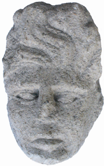
Fig. 6. - Fragmentul de relief votiv descoperit la Ocna Sibiului.