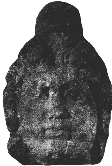
Fig. 7. - Fragment de statuie păstrat la Muzeul Național de Istorie a Transilvaniei

la cca 5 km nord de orașul actual și unde se afla o așezare rurală de epocă romană, atribuită populației autohtone 42 și datată mai ales în sec. III 43 , doar pe baza materialelor arheologice dacice și romane descoperite împreună în stratul de cultură, fără ca D. Protase să fi cercetat aici, de fapt, vreun complex închis (bordei, locuință, groapă de provizii) 44 și în condițiile în care datarea se bazează doar pe ceramica descoperită, pentru care nu există o cronologie a diferitelor tipuri întâlnite 45 și care reprezintă, de altfel, materialul arheologic predominant 46 . Autorul citat recunoaște, de asemenea, că stratul de cultură este relativ subțire, materialul arheologic descoperit apare în cantități reduse și este puțin variat, ceea ce arată că locuirea acestei sărăcăcioase așezări, al cărei sfârșit nu pare a se datora unei distrugerii violente, nu este una de durată și consideră că populația așezării s-a mutat în altă parte din motive de ordin economic 47 . După părerea sa,