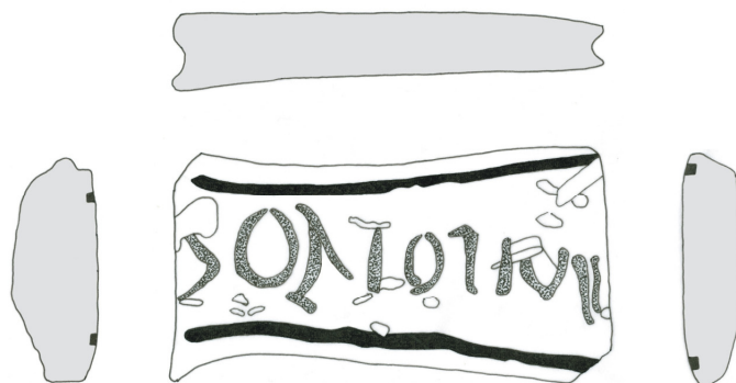
Fig. 4. - Desenul mânerului de pateră cu inscripție descoperit la Ocna Sibiului.